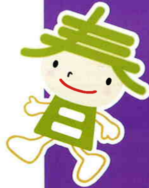
創立100周年記念 キャラクター「かすがちゃん」