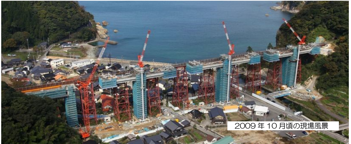
2009年10月頃の現場風景

■内容■ ①余部鉄橋の歴史と概要の説明・②現在の余部鉄橋の見学 ③新しい橋りょうの見学 ※内容は都合により変更する場合があります。